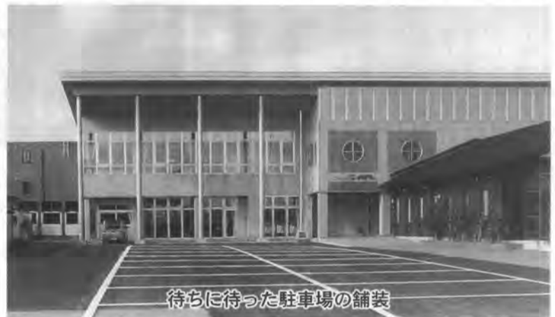
待ちに待った駐車場の舗装

一方、外装補修工事は、十年ひと昔といえども、日本海から四季を通じて吹き付ける風雪と塩害が災いしたものの、じわじわと痛めつけられた軒下、水切り等は腐食が進んで錆が浮き、見るに堪えないため、六十七万八千三百円を投じ、組合員である(株)カブリの手により長寿化を図られました。