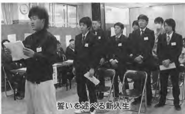
誓いを述べる新入生

地域別の事業数は、酒田市六事業所、鶴岡市四事業所、庄内町と三川町で二事業所、秋田県湯沢市(左官タイル科二年生)の十三事業所で、これも派遣して下さった事業主